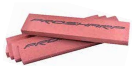
Kamień do gradowania ceramiczny- 5 w opakowaniu (PFB)