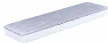
Kamień do gradowania diamentowo-ceramiczny (X-3)