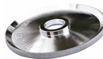
Diamentowa tarcza do SkatePal o grubości 100mm - gruba ziarnistość