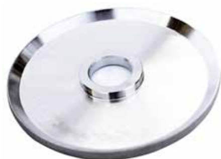
Diamentowa tarcza do SkatePal o grubości 100mm - drobna ziarnistość.