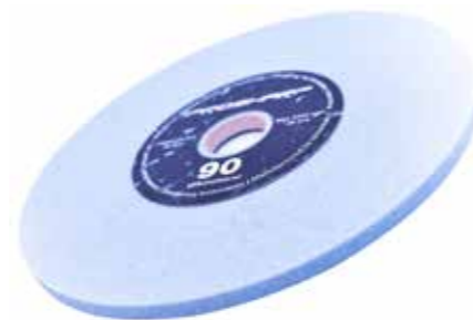
MA90 -drobnoziarnista, stosowana w maszynach AS 1001 i AS 2001.