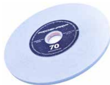
MA70 - gruboziarnista, stosowana w maszynach AS 1001 i AS 2001.