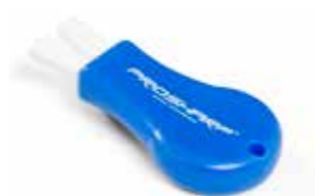
Podręczny kamień (PKY) - narzędzie do szybkiego gradowania w przerwie meczu.