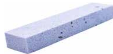
Kamień do gradowania polerujący (PPB)