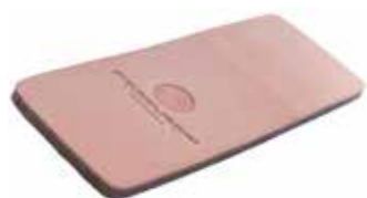
Kamień do gradowania ze skóry(PLH)