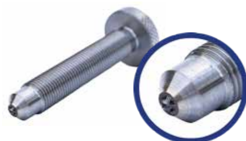
Naturalny; 0,3 karata.