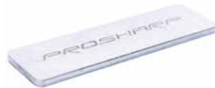
Kamień do gradowania diamentowy (PDB)